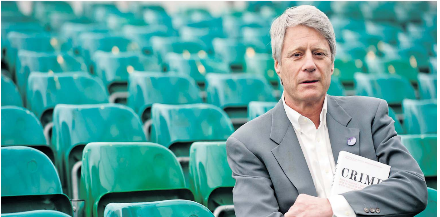
In Großbritannien kennt fast jeder Nick Ross, er hat unter anderem „Crime Watch“ moderiert, das „Aktenzeichen XY“ nachempfunden ist. Er ist aber auch Dokumentarfilmer, Psychologe und Kriminalist.